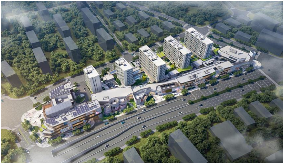
图：杭铁·翠著邱山里项目效果图

3月6日，杭铁开发的邱山大街项目亮相暨产品发布仪式落幕，项目案名为“翠著邱山里”。翠著邱山里位于临平老城核心区，东至景星观路、西至迎宾北路、南至邱山大街、北至沿山路，为地铁9号线上盖TOD项目，总建筑面积约6万多平方米。项目业态为住宅+商业，住宅约144套，主力户型有139平方米和189平方米，一梯两户，未来均为精装交付。翠著邱山里是杭铁开发独立操盘、自主开发的项目，也是杭铁开发首度落子临平，打造区域中高端改善人居社区和餐饮、新零售为主的TOD综合体项目，助力杭城TOD高质量发展。