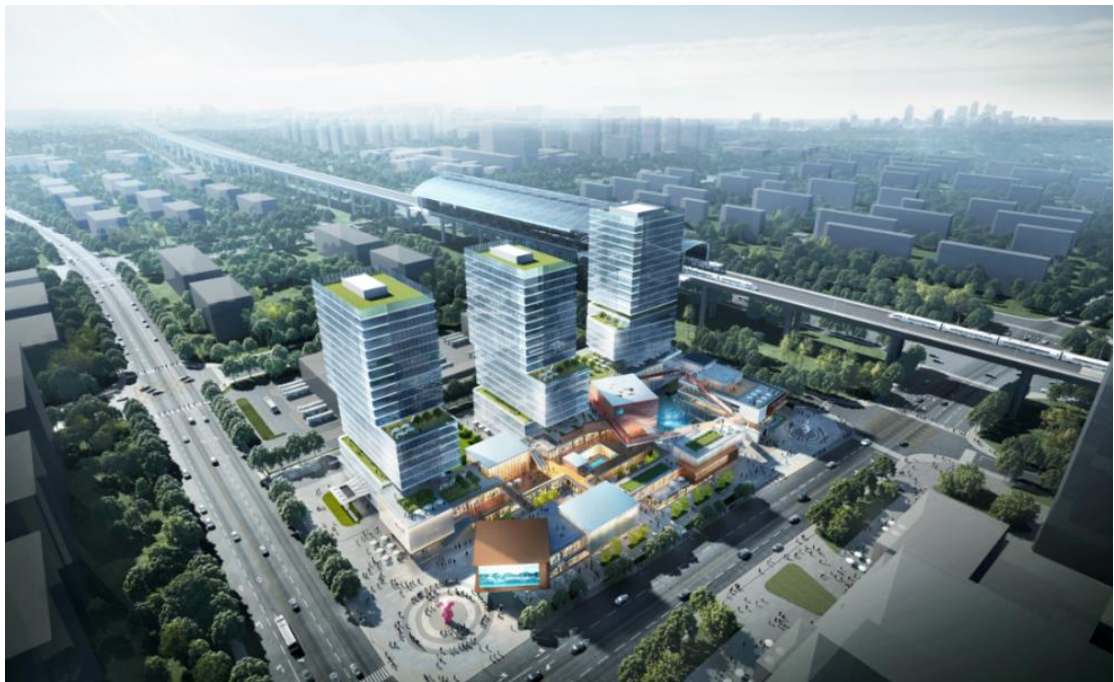
图：郑州大孟站 TOD 综合开发项目效果图

打造的郑州郑开城际大孟站 TOD 综合开发项目正式开工。该项目位于郑州国际文化创意产业园，属于郑开同城化先行示范区的核心区，南侧紧邻 4000 余亩牟山公园。根据规划，作为郑东首个 TOD，依托同晟“一站一城”开发模式，项目将构建“轨道交通、商业、城、人一体化”的立体微都市。项目占地 193.5 亩，地块内规划有 2 宗住宅和 2 宗商业，属于郑开城际铁路-大孟站配套用地，开发周期为 5 年，计划总投资约 26 亿元。