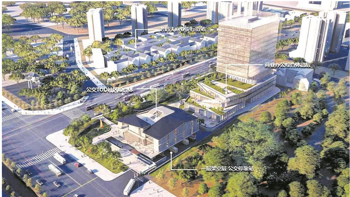
图：新津老码头公交 TOD 项目